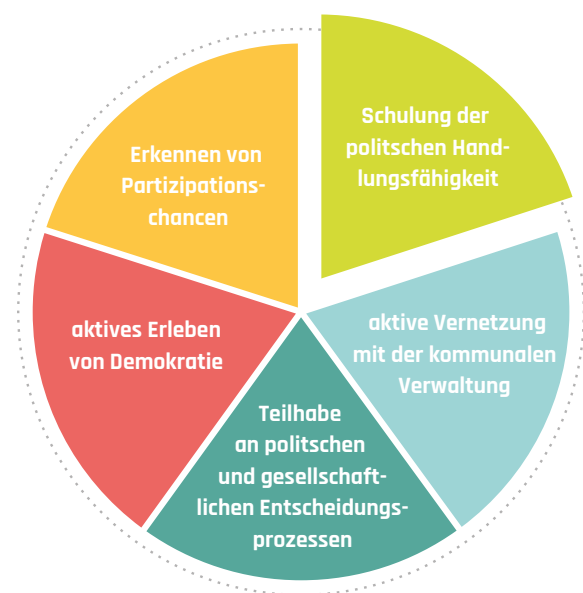
Abb. 1: Inhalte der Rahmenlehrpläne in den Angeboten

Unsere Schulformate orientieren sich an den Rahmenlehrplänen des Fachs Politische Bildung. Wir möchten Schüler*innen ein aktives Erleben von Demokratie ermöglichen. Bürgerbudgets bieten die Option, an einem realen politischen und gesellschaftlichen Entscheidungsprozess teilzunehmen und dabei politische Handlungsfähigkeit zu schulen . Durch Gespräche mit Vertreter*innen aus Politik und Verwaltung werden nicht nur Partizipationschancen beurteilt, sondern es wird auch aktive Vernetzung gefördert (siehe Abb. 1).