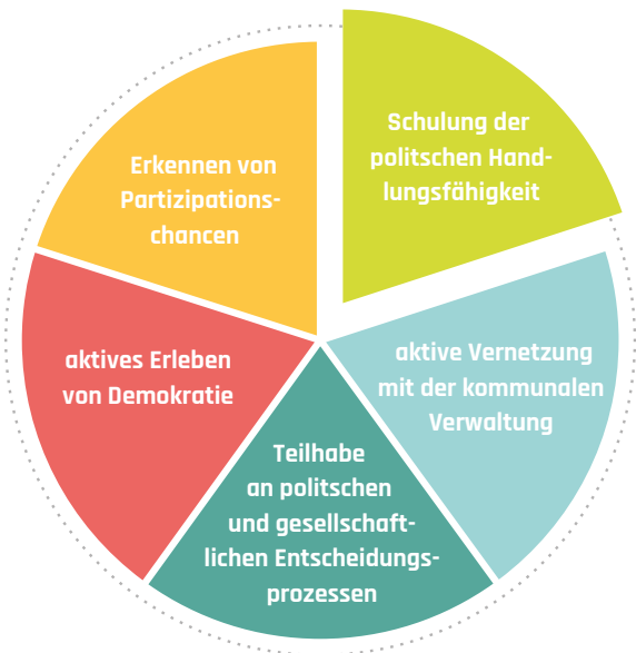
Abb. 1: Inhalte der Rahmenlehrpläne in den Angeboten

Unsere Schulformate orientieren sich an den Rahmenlehrplänen des Fachs Politische Bildung. Wir möchten Schüler*innen ein aktives Erleben von Demokratie ermöglichen. Bürgerbudgets bieten die Option, an einem realen politischen und gesellschaftlichen Entscheidungsprozess teilzunehmen und dabei politische Handlungsfähigkeit zu schulen . Durch Gespräche mit Vertreter*innen aus Politik und Verwaltung werden nicht nur Partizipationschancen beurteilt, sondern es wird auch aktive Vernetzung gefördert (siehe Abb. 1).