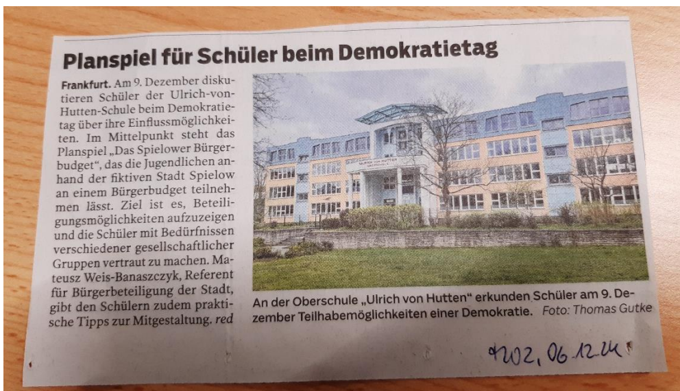
Presseartikel Märkische Oderzeitung, 6. Dezember 2024